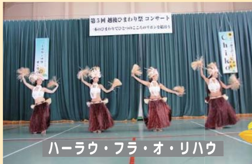
ハーラウ・フラ・オ・リハウ